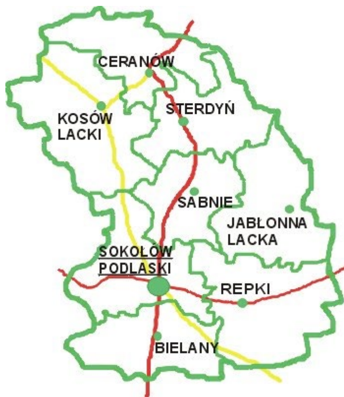
Mapa powiatu sokołowskiego

Liczba osób pracujących w powiecie sokołowskim (dane GUS na dzień 31.12.2007r.) wyniosła 18706 , w tym 8727 kobiet. Najwięcej pracowników zarejestrowanych było w sekcji Rolnictwo, łowiectwo, leśnictwo i rybactwo - 9574 osoby.